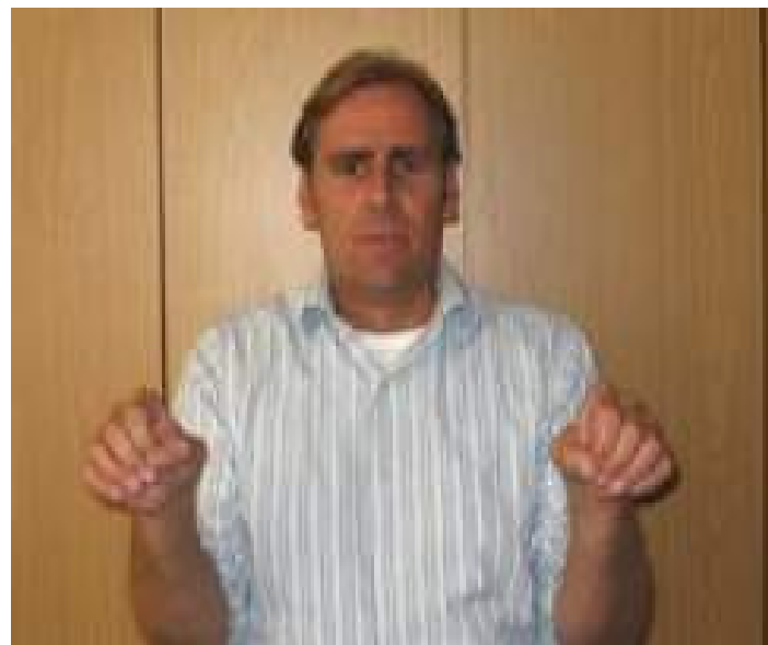
... ist ein wurstförmiger Bogen vor der Brust.