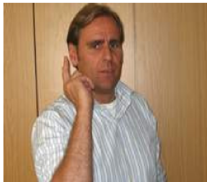
... erinnert einen Hamburger ans Haarschneiden.