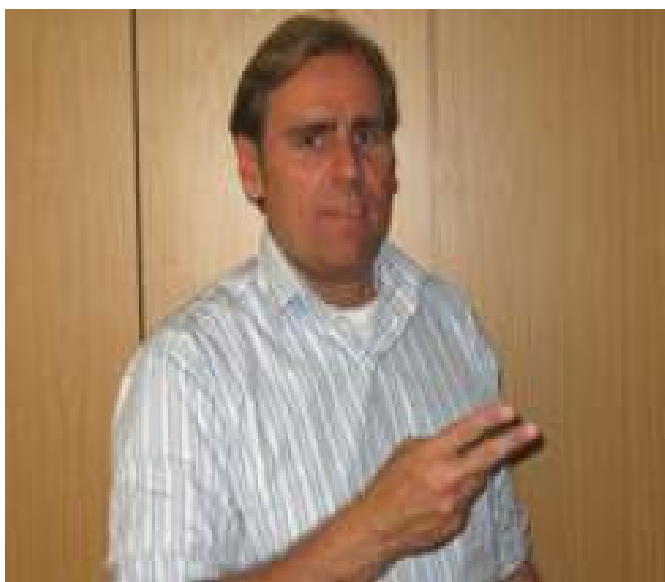
Eine Wurst in München ...